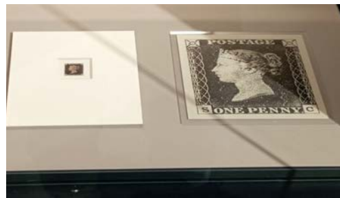
Photo d'un des premier timbre au monde.

Le timbre postal a été inventé en Grande-Bretagne en 1837 par Sir Rowland Hill. Il a permis d'affranchir le courrier à un tarif fixe (1 penny) et a révolutionné la poste en rendant les échanges de courrier plus accessibles à tous. Le premier timbre représentait la reine Victoria de profil. Le timbre se diffuse à la commercialisation à partir de 1840.